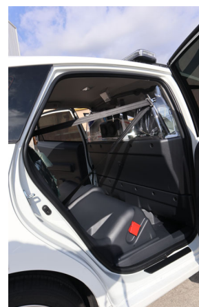
Kit de detenidos