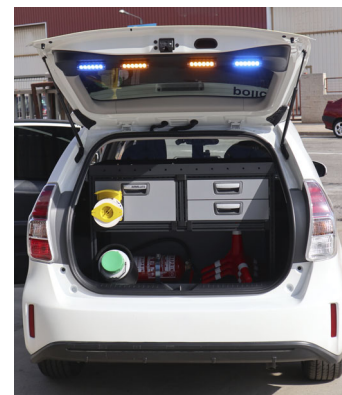
Luces puerta posterior