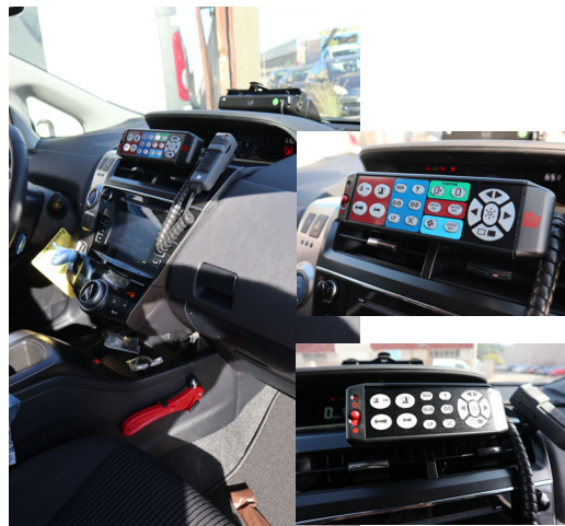
Cuadro de mandos y detalle del mando del puente